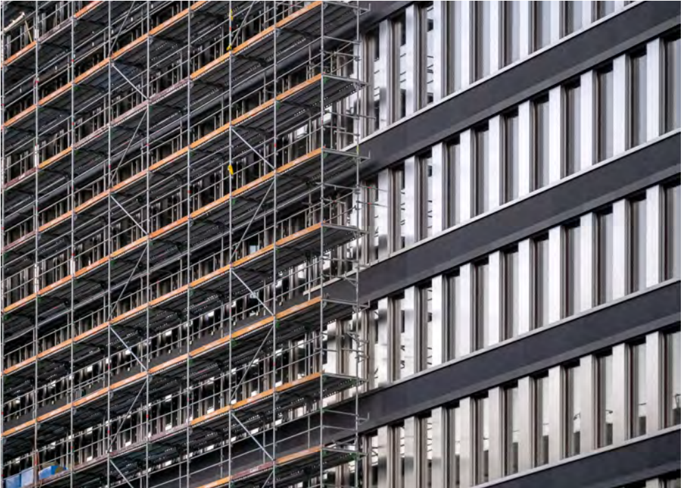
Zürich 15.6.2018